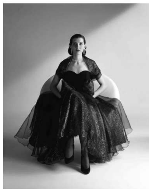
Egon von Furstenberg, 1987